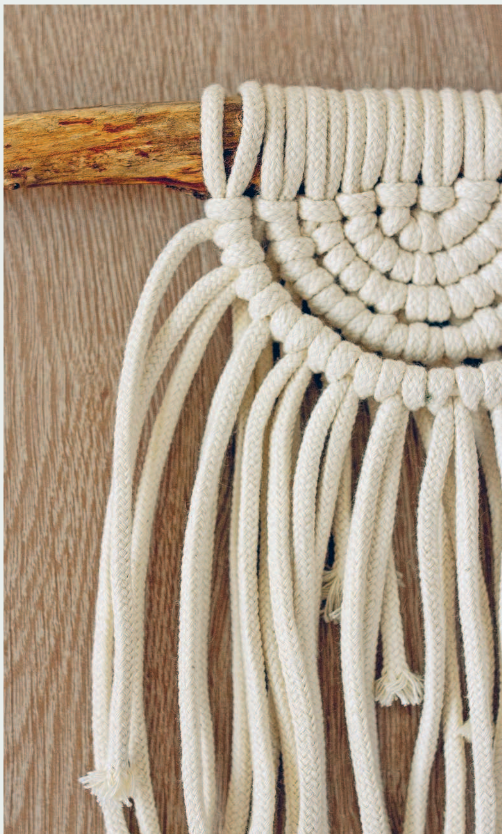
Пример плетения из хлопкового шнура ▶