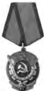
Орден Трудового Красного Знамени