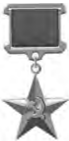
Медаль Героя Социалистического Труда