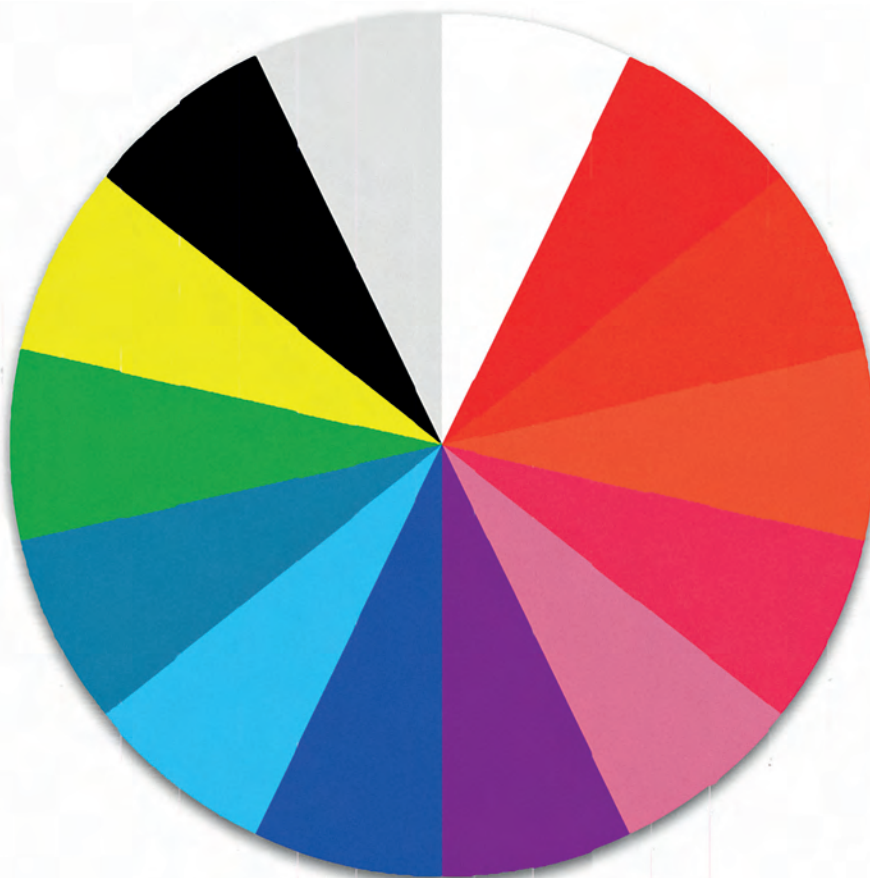
Схема «Краски осени»

А. Назовите цвета в схеме «Краски осени».