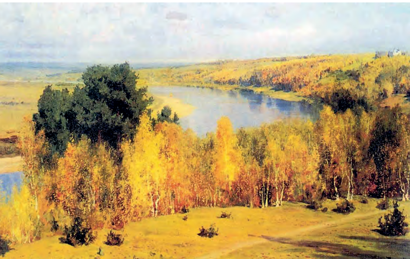
В.Д. Поленов. Золотая осень. 1893

Рассмотрите картину Василия Дмитриевича Поленова «Золотая осень». За одну минуту запомните как можно больше деталей. Через минуту закройте картину и опишите её.