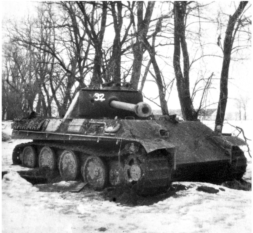
Брошенный экипажем танк Pz.V Ausf. G «Panther». Район озера Балатон, февраль 1945 года. На правом борту видна штанга для крепления бортового экрана, а также укладка ЗИП. Номер 32 нанесен советской трофейной командой (АСКМ).

Когда-то в августе 1944 г. прибытие двух эсэсовских дивизий в Польшу предопределило судьбу Варшавского восстания и остановило казавшееся безостановочным советское продвижение к польской столице. В случае начала нового советского наступления под Варшавой IV танковый корпус СС, несомненно, оказал бы существенное влияние на развитие событий. Однако сильное и опасное соединение буквально за две недели до начала Висло-Одерской операции было отправлено в Венгрию. Это решение во многом определило стратегию Германии в кампании 1945 г. В феврале 1945 г. едва ли не половина танковых дивизий немцев на восточном фронте была задействована в Венгрии. Следует отметить, что в отличие от многих других прорывов к окруженным группировкам, пробивание коридора в Будапешт не должно было завершиться эвакуацией гарнизона города. Напротив, предполагалось усилить