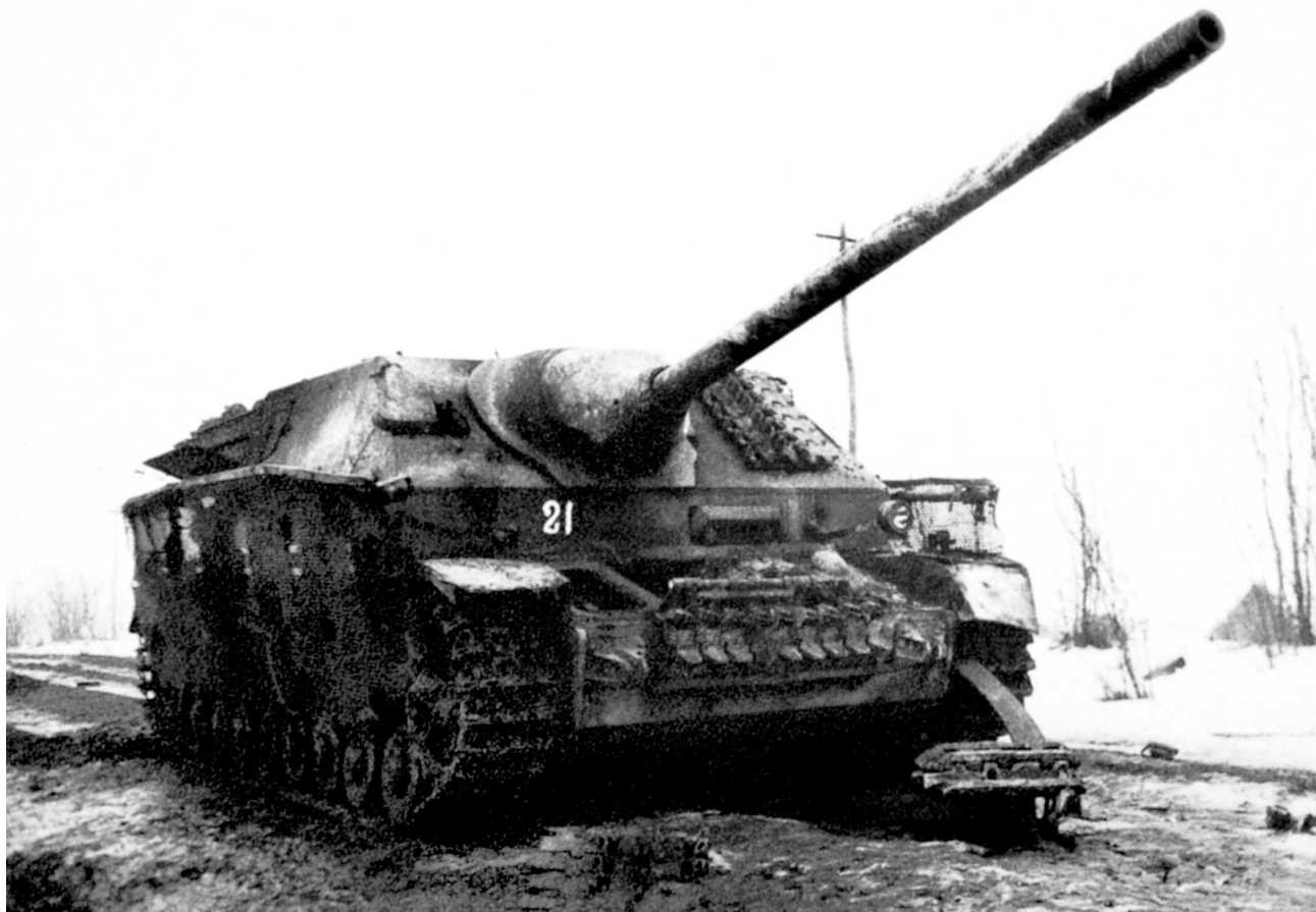
Истребитель танков Pz.IV/70 (А), подбитый в районе озера Балатон. Февраль 1945 года. Машина имеет сетчатые бортовые экраны и остатки зимнего камуфляжа. Номер 21 нанесен советской трофейной командой.

не приходится – им предстояло вступить в бой с колес. Однако их непосредственные руководители были немногим лучше. Лишь командующий группой армий «Юг» генерал пехоты Велер был в какой-то мере знаком с ТВД – ранее он командовал 8-й армией в Венгрии. Но при этом был новичком в качестве командующего группой армий. К началу операции по деблокадированию Будапешта он занимал этот пост всего восемь дней. Генерал танковых войск Бальк впервые командовал войсками в Венгрии и недавно принял командование 6-й армией. Он был одним из самых титулованных и известных германских танковых командиров Второй мировой войны. К январю 1945 г. он был кавалером Рыцарского Креста с Мечами, Дубовыми Листьями и Бриллиантами. К слову, Велер имел только Рыцарский Крест с Дубовыми листьями. Но если для Гилле задача прорваться в Будапешт – было признанием прошлых заслуг, то для Балька новое назначение было понижением. До этого он командовал группой армий «Г» на Западе. Присвое-