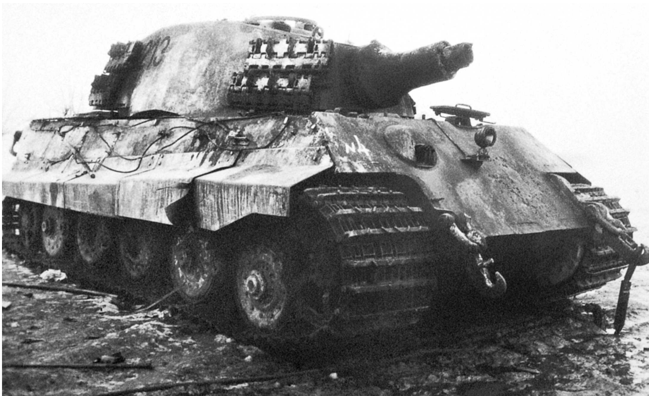
Танк SPz.VI Ausf. B «Königstiger» из состава 509-го батальона тяжелых танков, подбитый советской артиллерией. Район Будапешта, февраль 1945 года. Ствол танка отбит снарядом, машина имеет тактический номер 213, на башне закреплены запасные гусеничные траки.