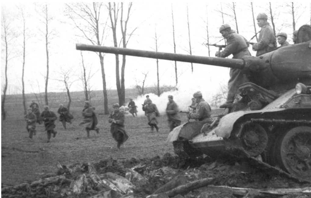
Танк Т-34-85 с десантом пехоты готовится к атаке. Венгрия, конец 1945 года.