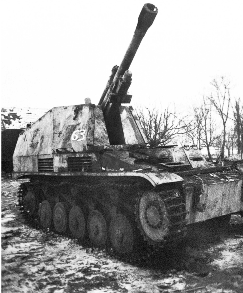
105-мм легкая самоходная гаубица «Wespe», брошенная экипажем на окраине Будапешта. Февраль 1945 года. Самоходка имеет зимний камуфляж, обозначения (кроме номера 63 советской трофейной команды) отсутствуют. Предположительно машина принадлежала 13-му артиллерийскому полку 13-й танковой дивизии.