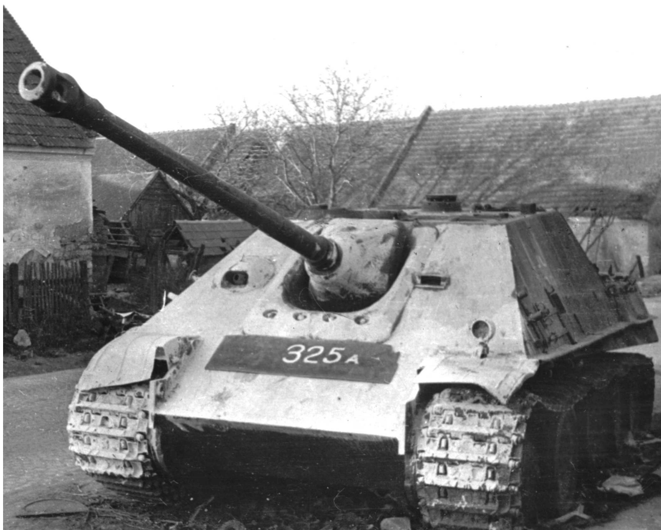
Истребитель танков «Jagdpanther» из состава 560-го тяжелого дивизиона истребителей танков, оставленный на улице венгерского населенного пункта из-за поломки или отсутствия горючего. Район озера Балатон, март 1945 года. Лобовой лист и передняя часть гусениц машины окрашены известью в белый цвет для того, чтобы самоходку было лучше видно ночью водителям проезжающих мимо автомашин.