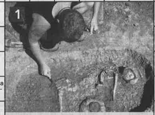
Ищет в земле следы древности