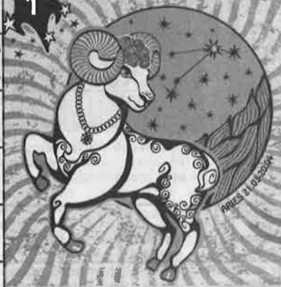
Барашек на звёздном небе