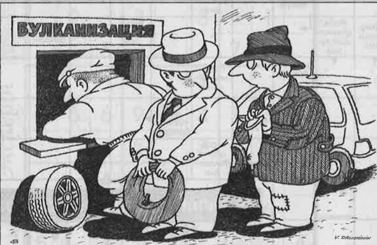
Карикатура: В. С. Дружинин

Женщинам нельзя носить тяжести, поэтому они несут чушь.