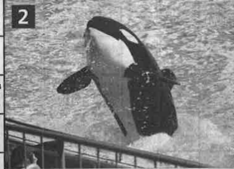
Хищник на шоу в дельфинарии