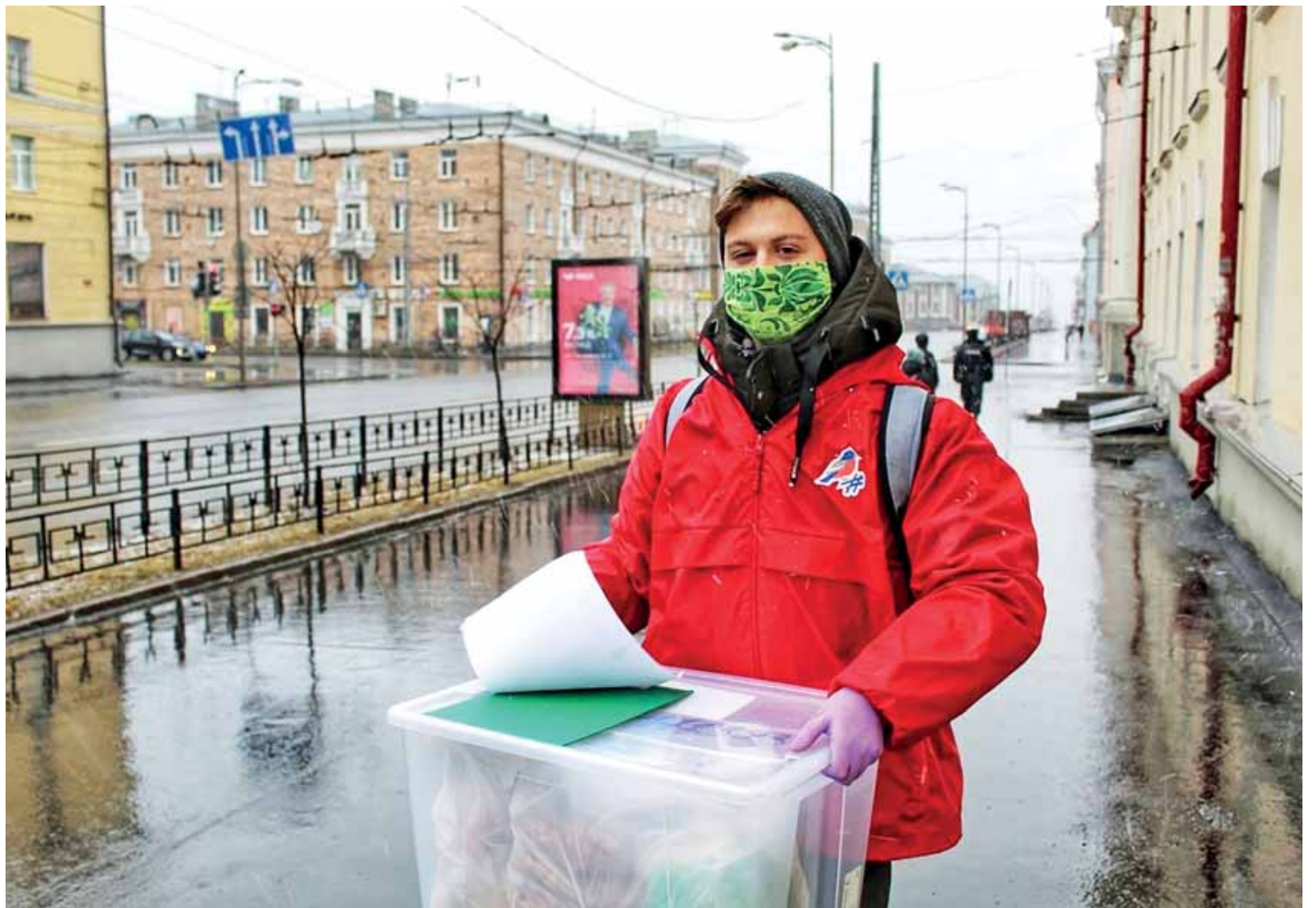
Vapaaehtoiset kuljettavat elintarvikkeita ja lääkkeitä yli 60-vuotiaille, joiden läheiset ja ystävät asuvat kaukana.