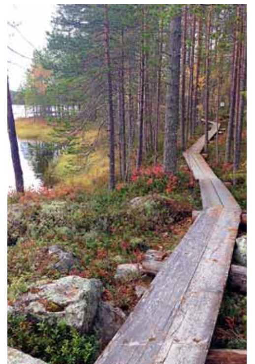
Vieraat tutustuvat muun muassa paikallisten asukkaiden elämäntapaan ja elinkeinoihin.

– Muodostamme pieniä ryhmiä, ja ne kulkevat lumikengillä polkua pitkin. Se on aika helppo ja kiinnostava aktiviteetti talvella, Tarhova sanoo. KS