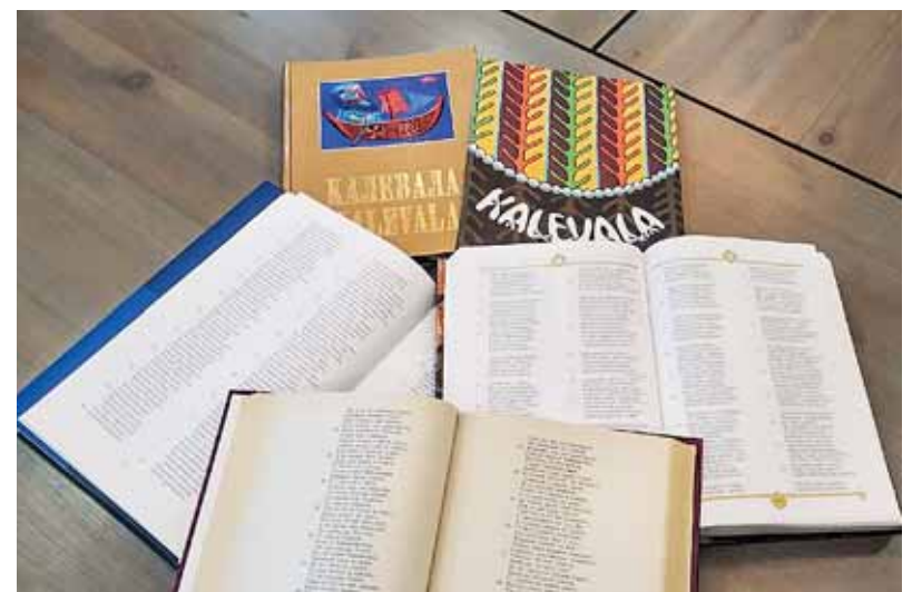
Karjalan kansallisesta kirjastosta Kalevala-epos löytyy 26 kielellä. Videoprojektin osallistuja valitsee itse kielen runon lausumiseksi. O+

Sääntöjen mukaan tempaukseen voivat osallistua vain Karjalan kansallisen kirjaston lukijat. Osallistujien ikää ei ole rajoitettu.