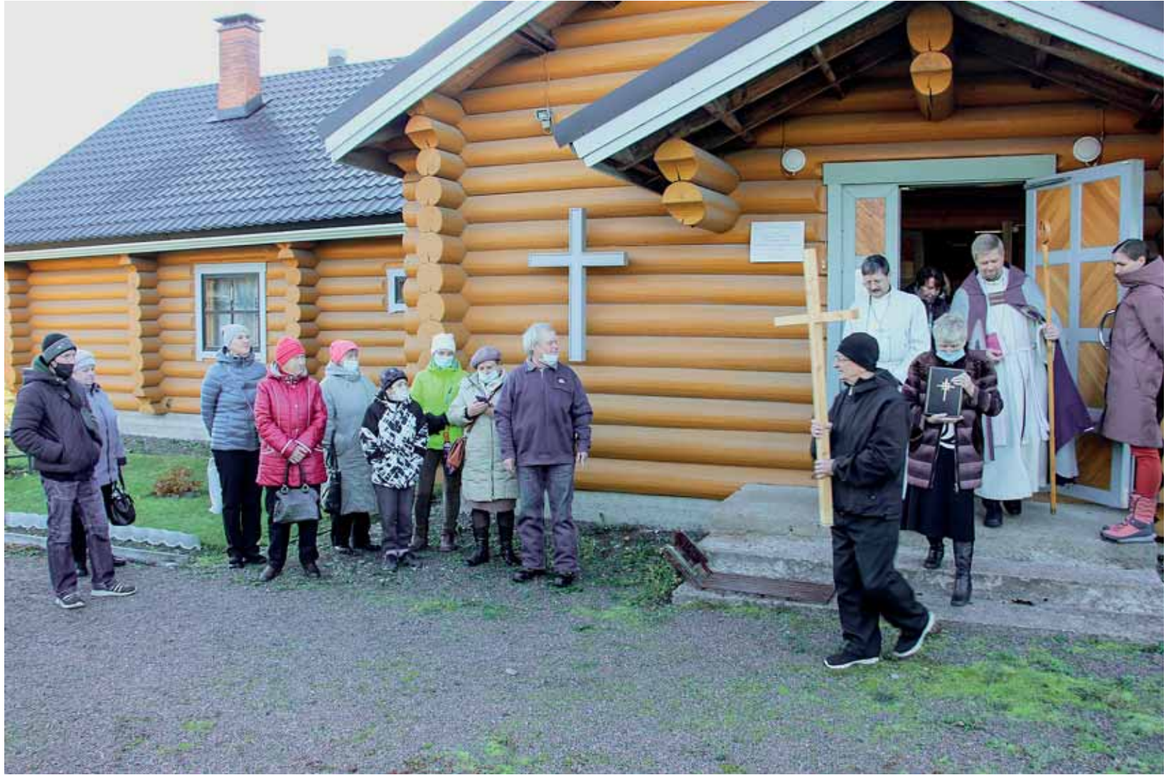
Inkerin evankelis-luterilaisen kirkon Pitkärannan seurakunta vietti lokakuun lopussa 30-vuotispäiväänsä. Seurakuntaan kuuluu yleensä iäkkäitä ja keski-ikäisiä naisia, joiden joukossa inkerinsuomalaisia on yli kolmasosa.