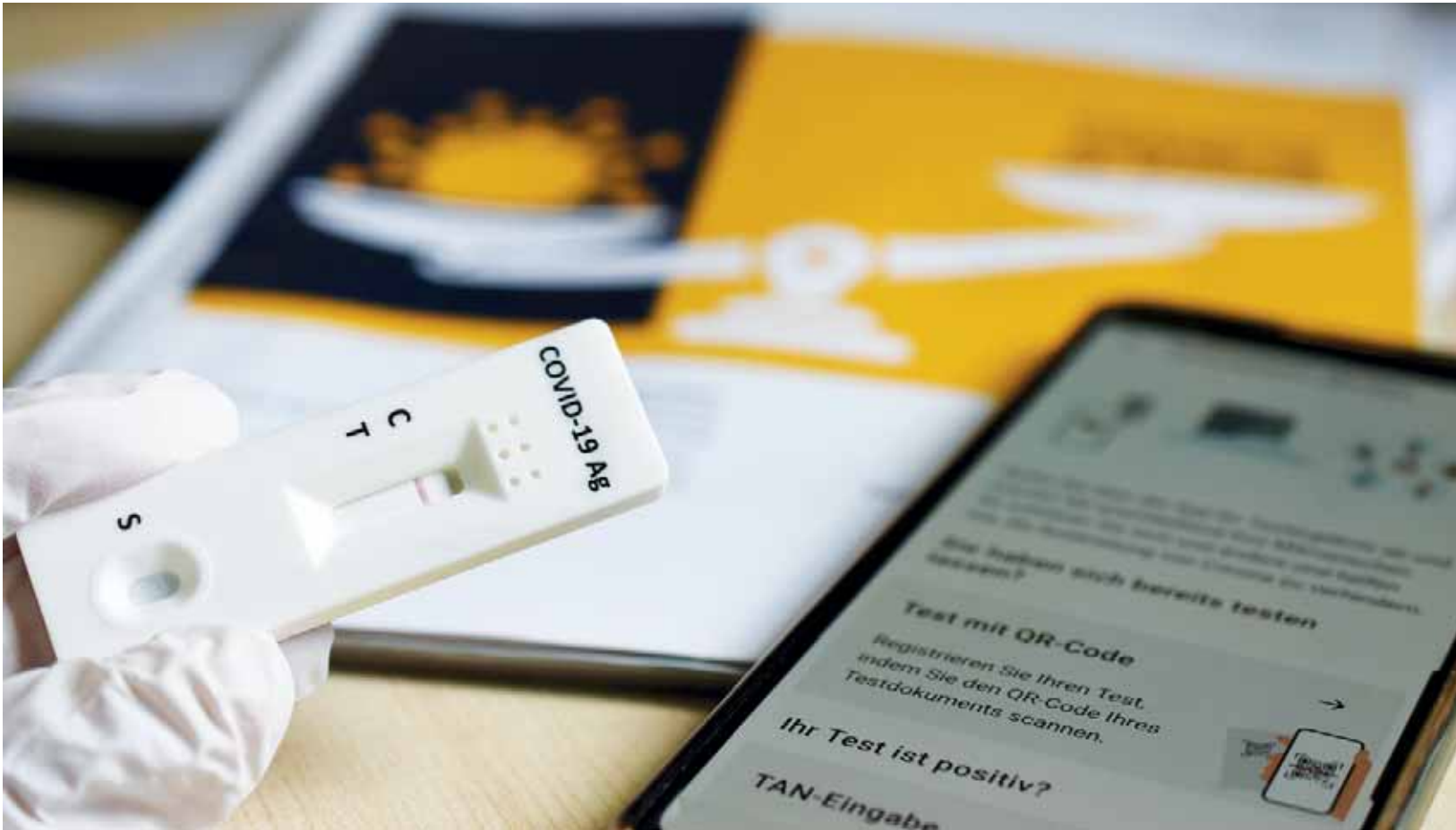
Nyt Karjalassa tehdään noin 4 600 testiä päivässä. Karjalan terveysministeriö on ostanut 15 000 pikatestiä. Lähiainaka ostetaan vielä 30 000 kappaletta.

"Karjalasta on tullut Venäjän ensimmäinen alue, jossa kaikille potilaille tehdään pikakoronatestejä."