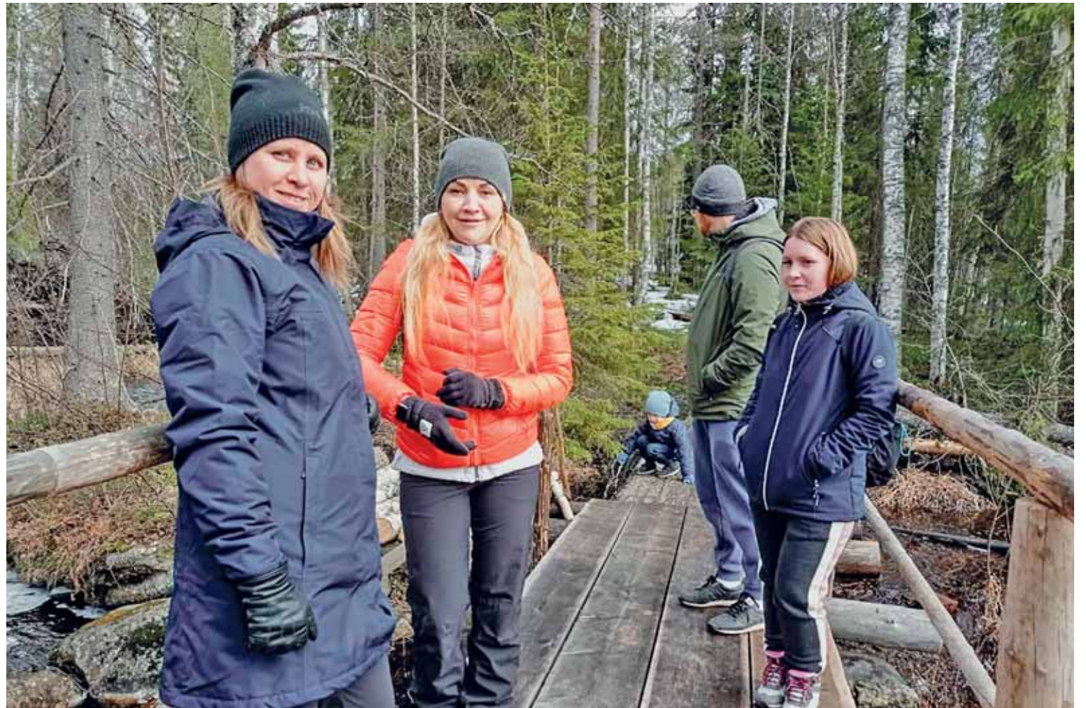
Turistit voivat kävellä laukkukauppioiden luonnonpolulla lenkkitossuissa, koska merkkiin paikkoihin on asetettu pitkospuut.

– Alueen suosio on kasvanut ja meidän on kehitettävä uusia aktiviteetteja. Parhailaan luonnonpuistossa on tarjolla kymmenisen reittiä ja ak-