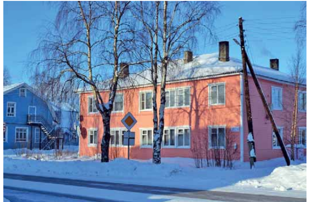
Kalevalan piiri sijaitsee Karjalan pohjoisessa ja kuuluu arktiseen alueeseen.

Presidentin asetus astuu voimaan 1. tammikuuta 2022. Samalla asetuksella pohjoisten seutujen listalta poistettiin Komi, Burjatia ja Permin aluepiiriin kuuluva Komi-Permjakien autonominen piirikunta.