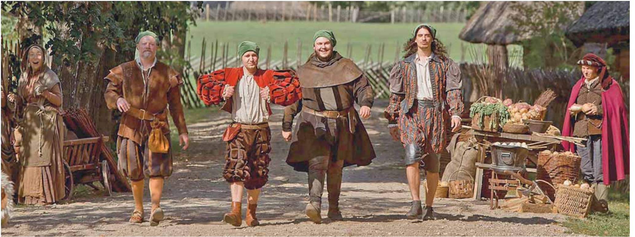
Tuore Joonan Tenan ohjaama komedia Peruna kertoo 1600-luvun startup-yrittäjistä, joka haluaa saada suomalaiset syömään uutta tulokasta, perunaa. 16+