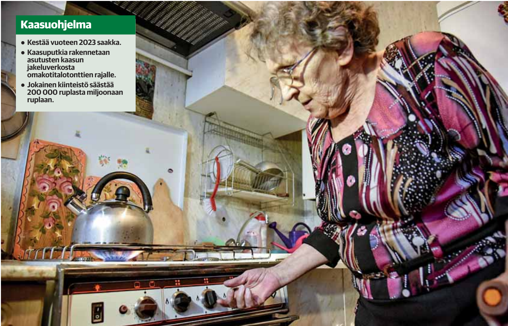
Kaasuohjelman etenemiseksi Karjalan hallitus on valmis myöntämään tukea vähävaraisille ja monilapsisille perheille asuintalojen siirtämiseksi maakaasun käyttöön.