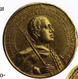
Медаль в память коронования Лжедмитрия I