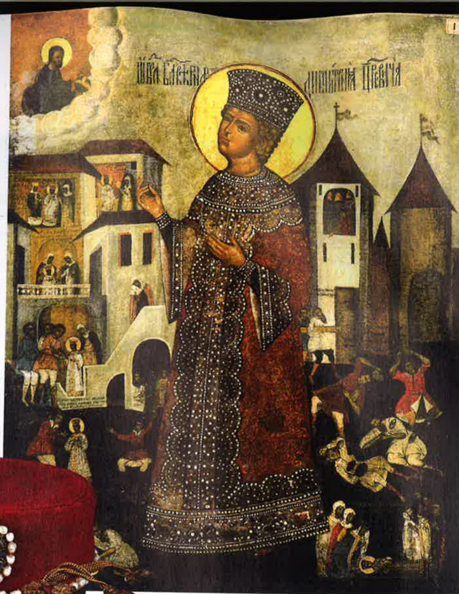
Царевич Дмитрий Углицкий. Икона. Вторая половина XVII века

В 1619-м Михаил Федорович встречал на въезде в Москву отца, освобожденного из польского плена и избранного