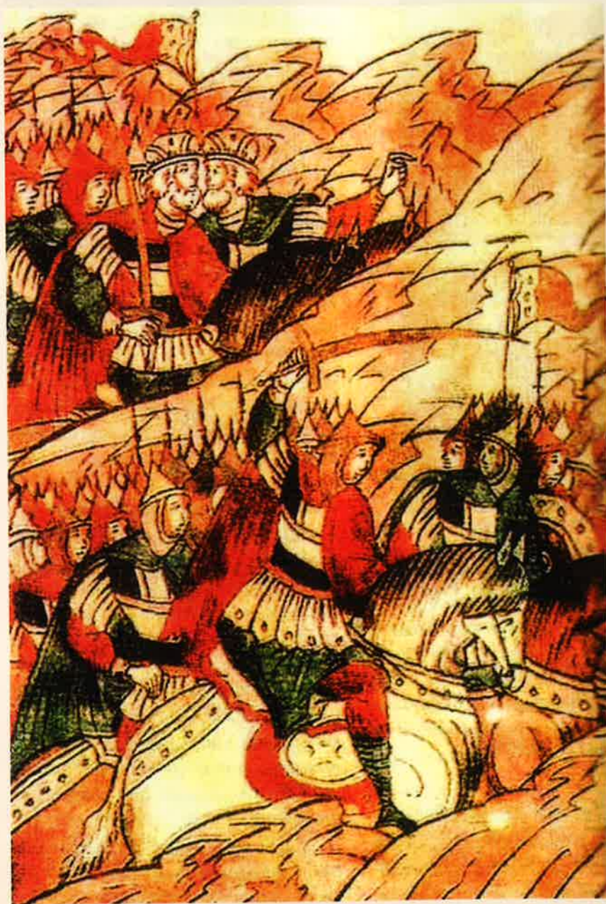
Липицкая битва. Вступление Мстислава Удатного в бой. Миниатюра из Лицевого летописного свода. XVI век

Сегодня о Липицкой битве напоминает нашлем Ярослава Всеволодовича, который он потерял во время сражения. Его обнаружили крестьяне в 1808 году. Эта реликвия хранится в Оружейной палате Московского Кремля.