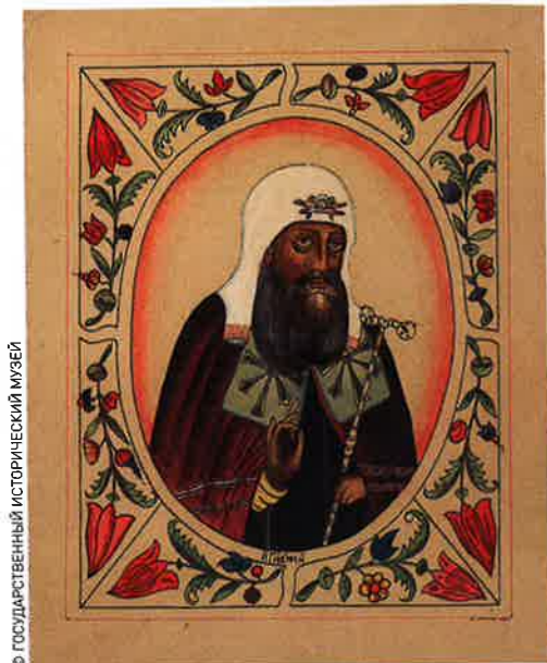
Портрет патриарха Московского и всея Руси Игнатия