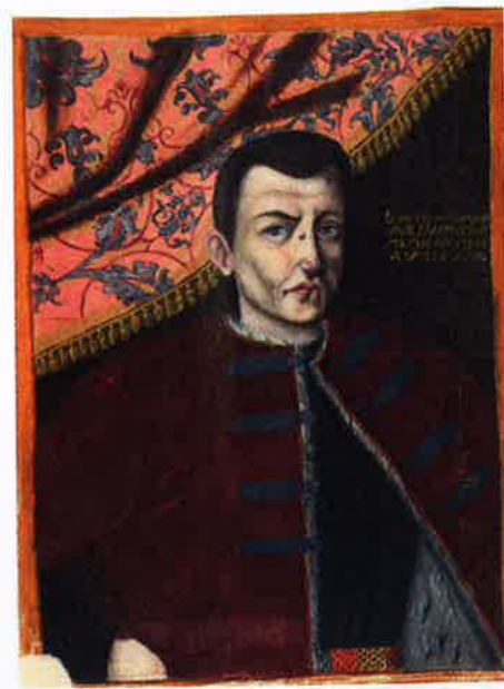
Портрет Лжедмитрия I. Библиотека Дармштадтского университета. 1604 год