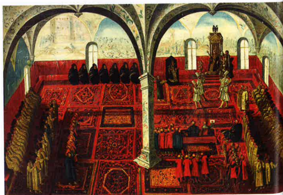
Прием польских послов Лжедмитрием I в Грановитой палате 3 мая 1606 года

В честь свадьбы был устроен фейерверк и выставлено щедрое угощение. Однако надменная полячка не пожелала подыграть мужу: она отказалась не только принять православие, но даже надеть русское платье и вообще относиться к «московитам» с нескрываемым презрением. Парадные портреты Марины из Королевского замка в Кракове хорошо передают гордыню юной красавицы и ее любовь