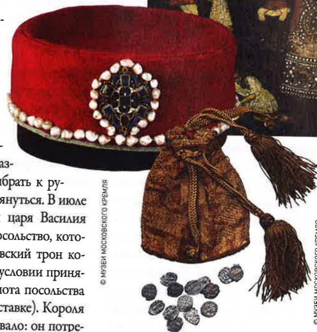
Вещи царевича Дмитрия