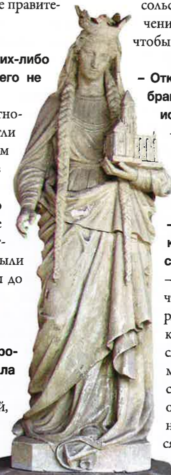
Anne de Kiev Reine de France

– Ни факта брака, ни имени. Но что касается имени – это в порядке вещей. Имена княжон мы, как правило, узнаем лишь в том случае, если они выходили замуж за кого-то известного, а так современники-летописцы мало обращали на них внимания. Однако имя Анны подтверждается огромным количеством зарубежных источников. Если открыть любые французские анналы того времени, там под 1051-м или каким-нибудь близким годом непременно будет сообщение о том, что Генрих женился