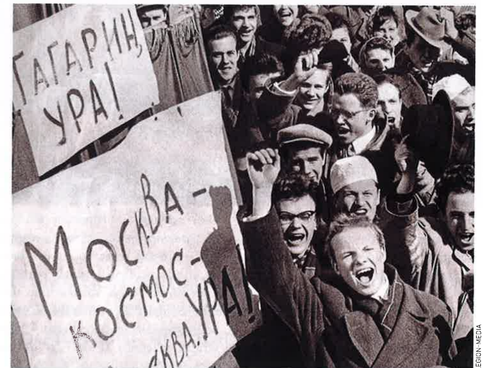
Всеобщее ликование на улицах Москвы 12 апреля 1961 года

В первый отряд космонавтов Юрия Гагарина зачислили приказом главкома ВВС от 7 марта 1960 года, после не-