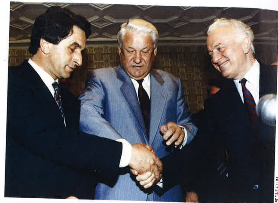
Председатель Верховного Совета Абхазии Владислав Ардзинба, президент РФ Борис Ельцин и председатель Госсовета Грузии Эдуард Шеварднадзе на переговорах по грузино-абхазскому конфликту. 3 сентября 1992 года

В сентябре 1993 года экс-президент Грузии прибыл из Грозного, чтобы возглавить своих сторонников, но оказался еще худшим стратегом, чем политиком. Потерпев поражение, он в декабре покончил с собой (по другой версии, был убит) в горном селе Дзвели-Хибула, где скрывался с немногими сто-