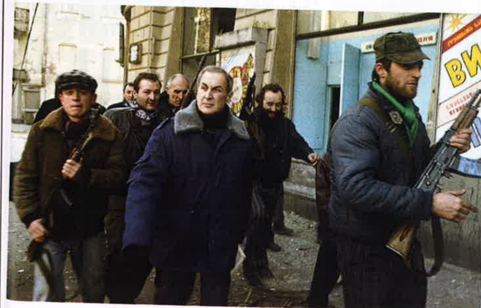
Джаба Иоселиани в сопровождении вооруженной охраны. Тбилиси, декабрь 1991 года

Впрочем, его политическая карьера на этом не кончилась: Гамсахурдиа, как видный «земляк», имел активную поддержку в Западной Грузии и Абхазии, грузинская община которой тоже придерживалась звиадистских взглядов. Во многом именно по этой причине (ради преодоления внутригрузинского национально-го раскола) вернувшийся в Тбилиси Эдуард Шеварднадзе решил провести «маленькую победоносную войну» против абхазов. Увы, «белому лису» этот маневр не удался. Вместо консолидации он получил 14 месяцев войны и потерю Абхазии, а в самый острый период грузино-абхазского конфликта звиадисты нанесли правительству Шеварднадзе удар в спину, открыв второй фронт против войск Госсовета Грузии в западной части страны.