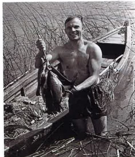
Юрий Гагарин на рыбалке. Июнь 1961 года

– Судя по списку проспектов (на нескольких континентах!), которые приходилось перекрывать, чтобы желающие увидеть Гагарина смогли сделать это, помахать ему, ни одного русского ни до, ни после так не принимали. У меня в книжке довольно много говорится про «вторую орбиту Гагарина» – его заграничное турне. Просто потому, что «домашние», советские свидетельства теоретически можно забракать как сфабрикованные под влиянием госпропаганды, а иностранцам такое обвинение не предъявишь. На