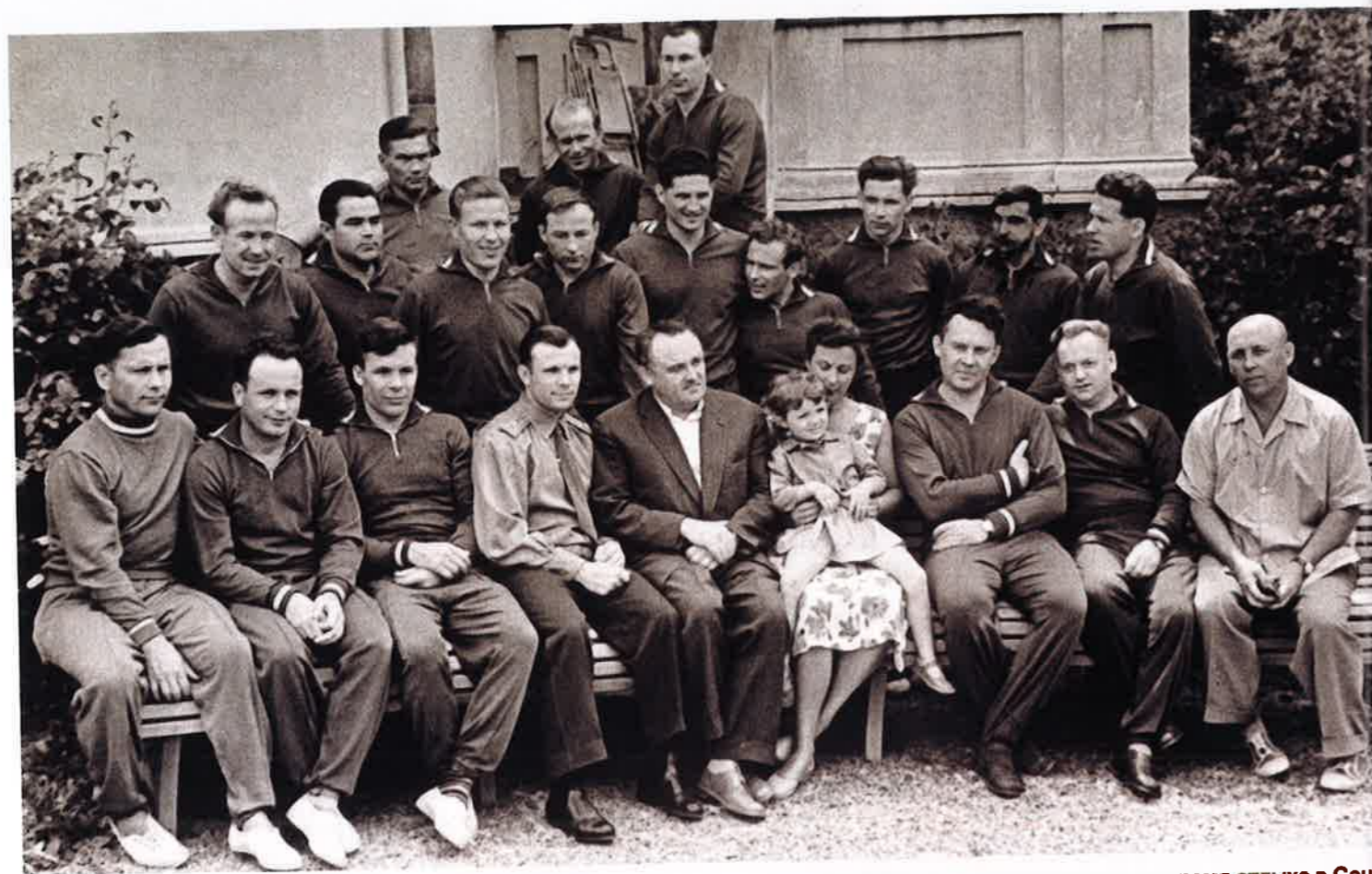
Первый отряд космонавтов во время отдыха в Сочи. В центре сидят Юрий Гагарин и главный конструктор Сергей Королев. Май 1961 года