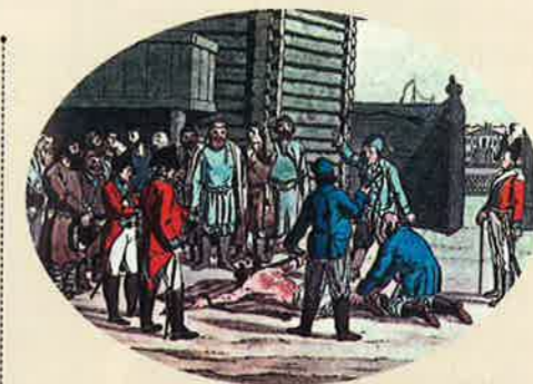
Наказание плетью в XVIII веке в Тайной канцелярии

Уже в 1731-м ее возродила императрица Анна Иоанновна как Канцелярию тайных и розыскных дел, начальником которой был назначен Андрей Ушаков. И снова главным орудием следствия