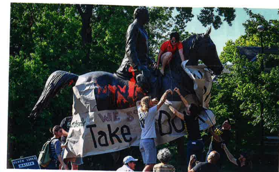
Снос памятника командующему армией конфедератов генералу Роберту Ли в штате Вирджиния

лись там, где жили раньше. Рабов они потеряли, а землю сохранили. Могли сдавать ее в аренду, в том числе неграм, диктовать свои экономические и политические условия. Вскоре они создали тайные террористические организации «Красные рубашки» и Ку-клукс-клан. Сопrotивление оказалось столь велико, что в 1867 году для претворения в жизнь программы Реконструкции конгресс принял решение о вводе войск в южные штаты. Юг разделили на военные округа. Войска находились там до 1877 года, когда Реконструкция была завершена.