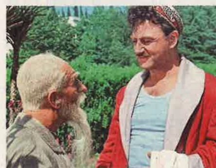
«Старик Хоттабыч» (1956)