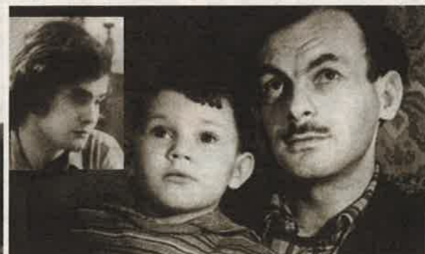
Игорь чувствовал себя ненужным, лишним. А когда ему исполнилось 10 лет, отец и вовсе ушел из семьи. Жизнь Игоря Окуджава сложилась трагически