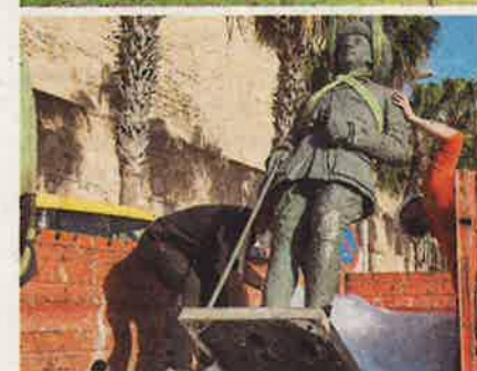
... А в феврале 2021-го в Испании был демонтирован последний памятник диктатору

Его низкий рост и subtilность вызывали у преподавателей Пехотной академии жалость. Юноше даже предложили облегченный карабин вместо тяжелой винтовки. Гордый курсант отказался. Позже, став первым лицом Испании, Франко старался избегать привилегий.