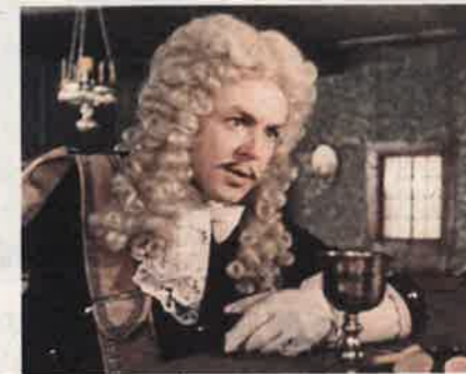
«Россия молодая» (1981)

удары судьбы. Но самое страшное ждало впереди.