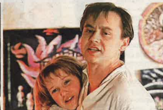
«Гори, гори, моя звезда» (1969)