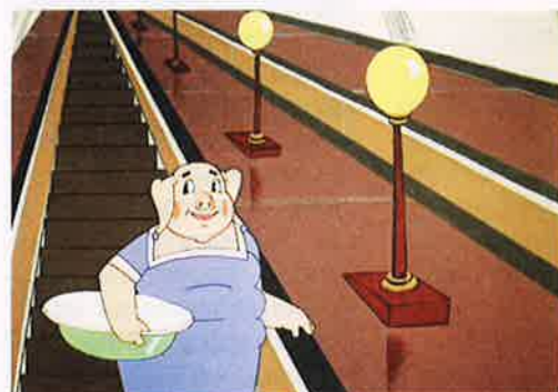
В мультфильме «Ну, погоди!» эскалатор метро практически пуст – для советского времени ситуация нетипичная. Чаще бывало наоборот – например, как в фильме «Операция «Ы»...»

СЛЕДУЮЩИЙ НОМЕР В ПРОДАЖЕ С 28 ИЮНЯ. НЕ ПРОПУСТИТЕ!