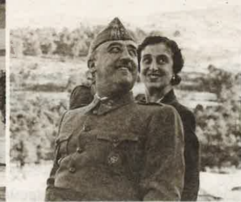
С женой, 1941 г. Про Кармен говорили: она была единственным лицом, обладавшим подлинным влиянием на каудильо

выбрали Франко – расчетливого и смелого вояку. И тот поклялся до последней капли крови служить своей стране.