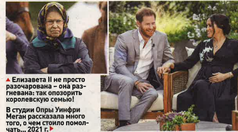
▲ Елизавета II не просто разочарована – она разгневана: так опозорить королевскую семью!

В дополнение к этому стали появляться из ниоткуда родственники Меган – близкие и дальние, которые оказались не прочь поделиться неличеприятными подробностями юности гер-