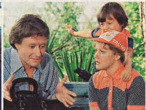
«Будьте моим мужем» (1981)