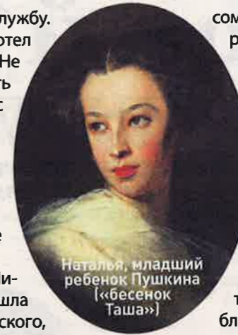
Наталья, младший ребенок Пушкина («бесенок Таша»)

Долгое время Григорий Пушкин жил с французенкой, которую не признавали его родные. Выдав замуж трех своих незаконнорожденных дочерей, наследник поэта расстался с пассией и женился на Варваре Мошковой. В 1899 году он принял непростое для себя решение — передать фамильную усадьбу казне — и уехал в имение жены Маркутье под Вильню-