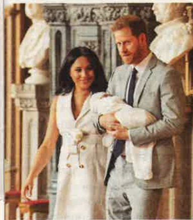
Первое фото с сыном Арчи, 2019 г. Родители не стремятся рассказывать миру о малыше и показывать его

Спустя несколько месяцев после свадьбы Меган объявила, что они с Гарри ждут первенца. А 6 мая 2019