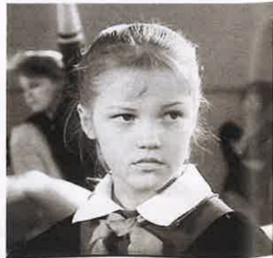
«Звонят, откройте дверь» (1965)

В начале 1980-х во время работы над фильмом «Будьте моим мужем» за Еленой стал ухаживать ее партнер Андрей Миронов. Все было очень красиво, пока не приехала супруга Миронова, актриса Лариса Голубкина, которой уже