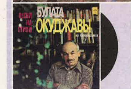
Песни Булата Окуджавы звучат в «Покровских воротах» и других известных фильмах