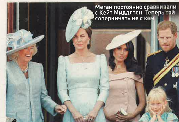
Меган постоянно сравнивали с Кейт Миддлтон. Теперь той соперничать не с кем