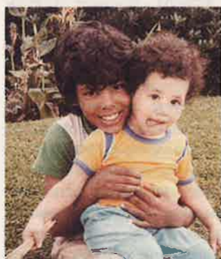
Больше всего вопросов у королевы вызвал цвет кожи Меган. Будущая герцогиня со своим кузеном

Меган не раз повторяла, что королева и ее родственники мало ее волновали. А потому и знакомство с младшим сыном принцессы Дианы состоялось... неожиданно.