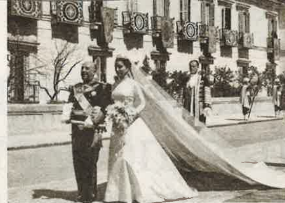
Франко ведет свою единственную дочь к алтарю, где та должна обвенчаться с маркизом Вильяверде. 1950 г.