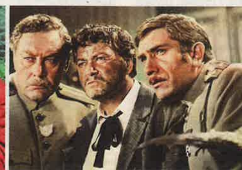
«Неуловимые мстители» (1966)