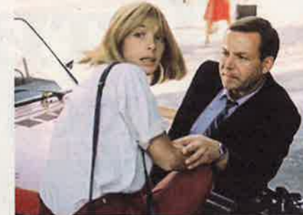
«Выйти замуж за капитана» (1985)