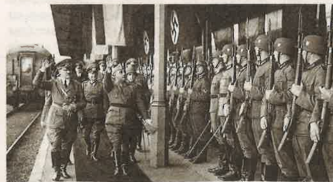
Встреча Франко и Гитлера, 1940 г. Отказ испанца вступить в войну разочарованный фюрер прокомментировал так: «Франко – неблагодарный негодяй. У него манеры сержанта!»

Старт путча случился в Марокко, где были сосредоточены элитные части. На следующий день костер войны уже бушевал в самой Испании, ибо сигнал к ней был передан по национальному радио. В городах зазвучали выстрелы, на улицах появились баррикады, а вооруженные люди сеяли хаос и смерть... Вылетевший в Испанию генерал Санхурхо и сам погиб в результате авиакатастрофы. Лидером восстания