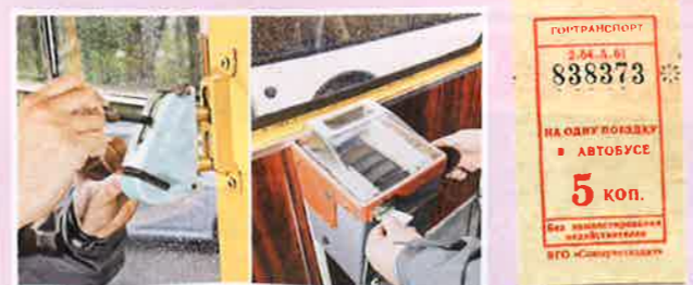
Лучший контролер – это совесть! Компостер и билетная касса. Справа – талон, который вручную пробивали в компостере