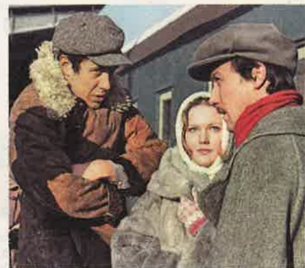
«Янковский – это была моя любовь, мы встречались...» «Сентиментальный роман» (1976)