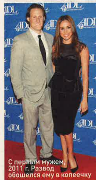
С первым мужем, 2011 г. Развод обошелся ему в копейку

Вскоре общественности стало не нравиться буквально все, что делает Маркл: обязанности выполняет неважно, улыбается чрезмерно приторно, постоянно держит Гарри за ручку, смеется неуместно. Пресса умудрилась обвинить Меган даже в том, что