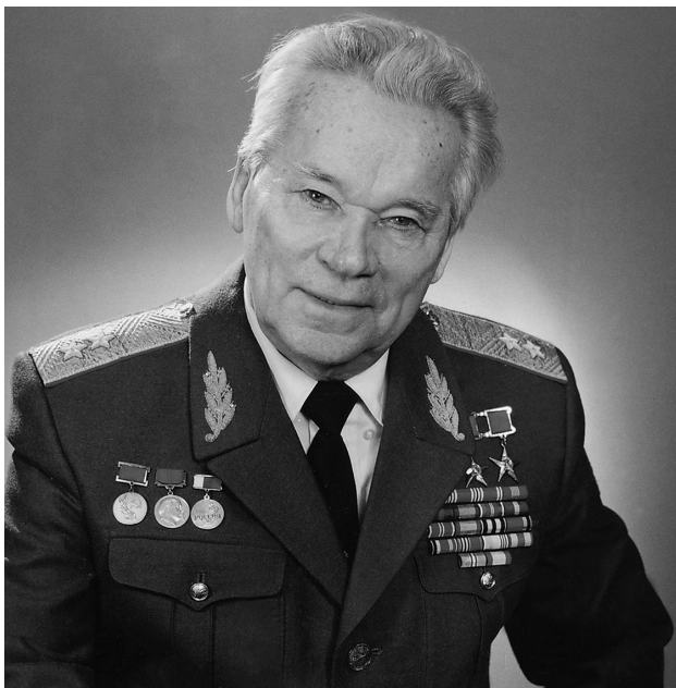
Михаил Тимофеевич Калашников

Задание 1. Посмотрите на фото. Знаете ли вы этого человека? Кто он по профессии? Чем знаменит этот человек? Что он создал?