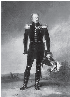
Император Александр I

Согласимся, что деяния, описанные Геродотом, Фукидидом, Ливием, для всякого нерусского вообще занимательнее, представляя более душевной силы и живейшую игру страстей: ибо Греция и Рим были народными державами и просвещеннее России; однако ж смело можем сказать, что некоторые случаи, картины, характеры нашей истории любопытны не менее древних. Таковы суть подвиги Святослава, гроза Батыева, восстание россиян при Донском, па-