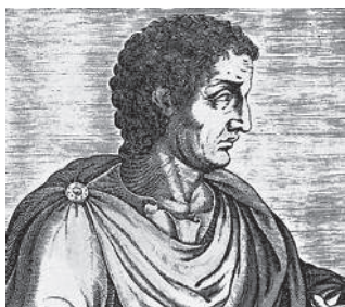
Плиний Старший (23–79 н.э.). Был знаменит своим трудолюбием

Обращаюсь к труду моему. Не дозволяя себе никакого изобретения, я искал выражений в уме своем, а мыслей единственно в памятниках; искал духа и жизни в тлеющих хартиях; желал преданное нам веками соединить в систему, ясную стройным сближением частей; изображал не только бедствия и славу войны, но и все, что входит в состав гражданского бытия людей: успехи разума, искусства, обычаи, законы, промышленность; не боялся с важностью говорить о том, что уважалось предками; хотел, не изменяя своему веку, без гордости и насмешек описывать веки душевного младенчества, легковерия, баснословия; хотел представить и характер времени и характер летописцев: ибо одно казалось мне нужным для другого. Чем менее находил я известий, тем более дорожил и пользовался находимыми; тем менее выбирал: ибо не бедные, а бо-