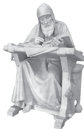
Нестор-летописец. Памятник работы М.М. Антокольского

летописцев иноземных согласны с ними. — Сия почти непрерывная цепь хроник идет до государствования Алексея Михайловича 7 . Некоторые донныне еще не изданы или напечатаны весьма неисправно 8 . Я искал древнейших списков: самые лучшие Нестора и продолжателей его суть харатейные, Пушкинский и Троицкий , XIV и XV веков 9 . Достойны также замечания Ипатьевский , Хлебниковский , Кёнигсбергский , Ростовский , Воскресенский , Львов-