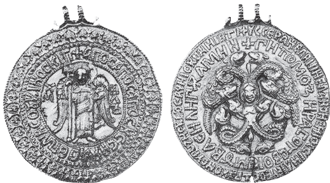
Материальные источники: Змеевик Владимира Мономаха (амулет в виде медали)

ский, Архивский 10 . В каждом из них есть нечто особенное и действительно историческое, внесенное, как надобно думать, современниками или по их запискам. Никоновский более всех искажен вставками бессмысленных переписчиков, но в XIV веке сообщает вероятные дополнительные известия о Тверском княжении; далее уже сходствует с другими, уступая им однако ж в исправности, — например, Архивскому .